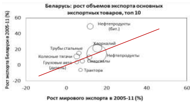
Рисунок 1: Рост экспорта основных товаров Беларуси (2005-2011)

Источник: оценки Всемирного банка на основе данных Comtrade.