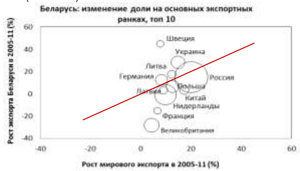
Рисунок 2: Увеличение доли Беларуси на основных экспортных рынках (2005-2011)

Источник: оценки Всемирного банка на основе данных Comtrade.